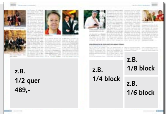
S. 8 ff